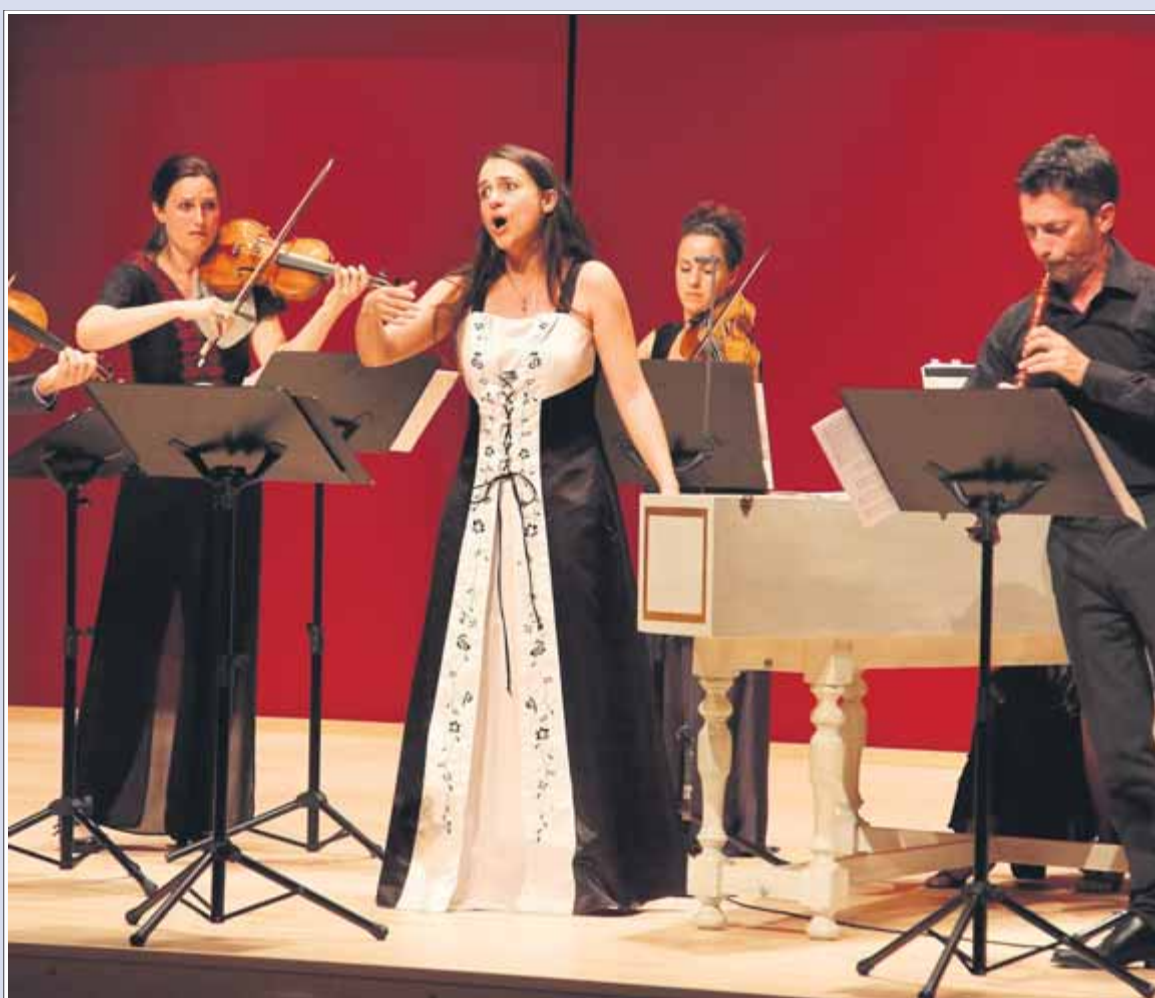
La soprano Núria Rial, en una actuació al Festival de Torroella de Montgrí amb l'Acadèmia 1750 el 2013

La soprano Núria Rial, una de les veus catalanes més internacionals del moment, presenta l'àlbum Vocalise , que va enregistrar el gener del 2017 a Basilea amb els Vuit Cel·listes de l'Orquestra Simfònica de Basilea. Es tracta d'un CD eclèctic en el qual hi trobem des de peces d'Astor Piazzolla ( Four Seasons of Buenos Aires ), les Bachianas Brasileiras n. 5 d'Heitor Villa-Lobos i la cançó popular El cant dels ocells amb arranjaments de Bernat Vivancos. Però la cirereta del pastís és la peça Vocal Ice , de Bernat Vivancos, que s'ha enregistrat per primer cop. El compositor la va escriure expressament per a la soprano catalana i, tot i no tenir lletra, conté una forta càrrega emocional. Vivancos es va inspirar en la Pietà de Michelangelo per escriure una música sobre l'amor i la consolació, una obra que Rial interpreta amb mestria i que troba un eco clar en la melancolia d' El cant dels ocells que tant estimava Pau Casals. *