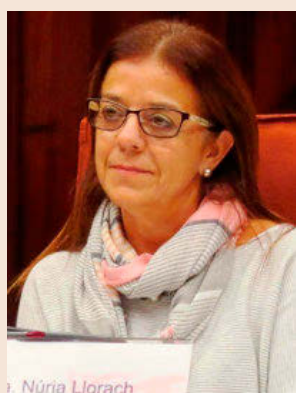
Núria Llorach preside la Corporació de Mitjans (CCMA).

En la comisión de control de la CCMA en el Parlament, afirmó que, en cambio, el presupuesto de gasto se está cumpliendo. La directiva señaló que la Generalitat ha realizado una aportación extraordinaria de 3,5 millones de euros, que se han destinado a la compra de contenidos, que no estaban inicialmente