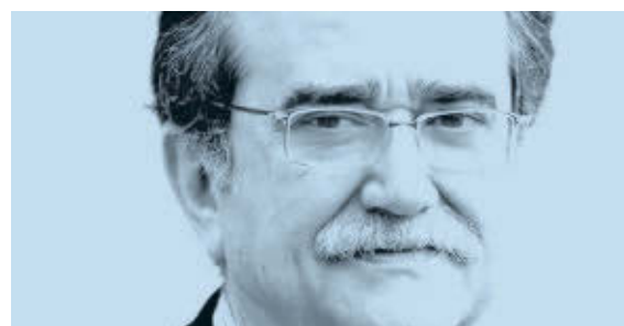
PER JOSEP MARIA MARTÍ @diaridetarragona

Disparar al pianista. Fer culpables de les derives polítiques dels mitjans públics els professionals que hi treballen, s'ha convertit en una pràctica habitual dels partits polítics de dreta i esquerra