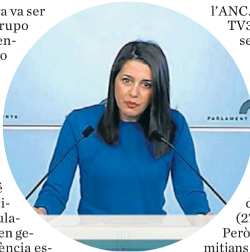
La presidenta del grup de Ciutadans al Parlament, Inés Arrimadas, en un tall emès al Telenotícies vespre d'aquest dimarts.

L'informe també comptabilitza les aparicions de les "entitats vinculades al debat polític", que en general van tenir una presència escassa en els informatius diaris dels mitjans analitzats: entre un 3,9% del temps total de paraula, en el cas de TV3, i un 1,9%, a TVE Catalunya. L'Assemblea Nacional Catalana (ANC) i Òmnium Cultural acaparen un 90,5% d'aquests minuts a 8TV, un 73,6% a Catalunya Ràdio i un 61,4% a TV3, que també va dedicar un 21,7% del temps a l'Associació Catalana pels Drets Civils (ACDC). En el cas de RAC1, aquesta va ser l'entitat amb més temps de paraula, un 31,8%, per davant de l'ANC (28,7%) i Òmnium (27,1%). En canvi, a TVE Catalunya l'organització amb més presència va ser Societat Civil Catalana (SCC), que va tenir un 32,8% del temps, per davant del 23,1% d'Òmnium i del 18,9% de