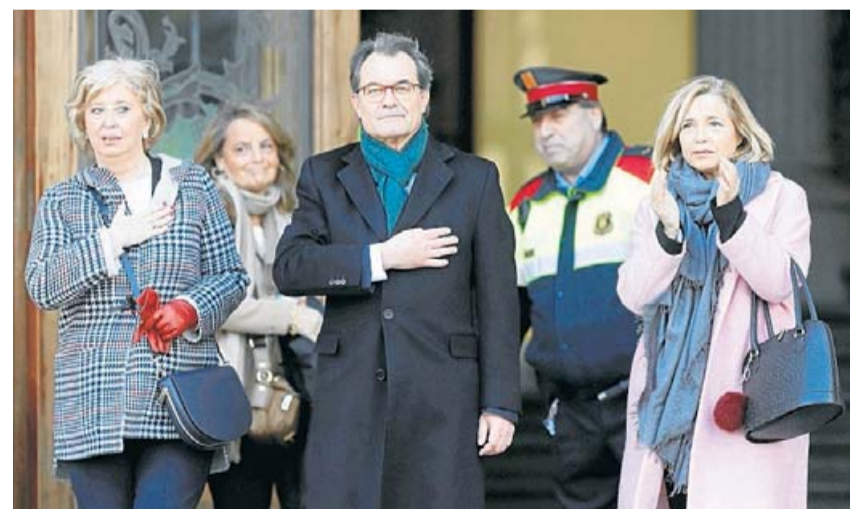
L'expresident Artur Mas i les exconselleres Joana Ortega i Irene Rigau a les portes del TSJC durant el judici del 9-N.

El tribunal notificarà avui la resposta als afectats -Artur Mas, Joana Ortega, Irene Rigau, Francesc Homs i la resta d'alts i exalts càrrecs del Govern implicats-, que tindran fins al 13 de novembre per dipositar la garantia. Paral·lelament, hi ha interposats dos recursos per part de la defensa que demanen suspendre l'obligació del pagament preventiu de la fiança. Un d'ells denuncia la in-