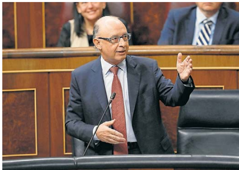
El ministre d'Hisenda, Cristóbal Montoro, durant una intervenció al Congrés aquest dimecres.